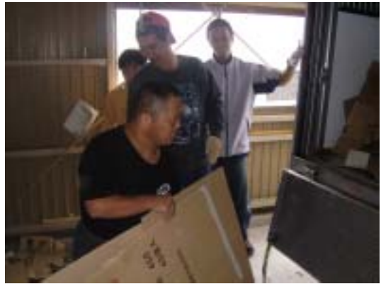
【古紙回収の様子(あかね寮)】