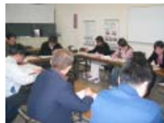
オフィス古紙リサイクル会議の様子

詳細は同友会事務局(TEL:077-561-5333 E-mail:info@shiga.doyu.jp)までお問い合わせください。