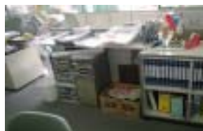
写真1 古紙回収箱の様子

地球環境を守り、ハンデキャップがある方々の就労の機会、その施設の収益を少しでも良くするための社会運動です。是非、同友会会員が中心となって、大きな成果を挙げられる事を期待して、地道な活動を続け、広げていきましょう。