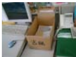
写真2 古紙回収箱の様子

さらにオフィス内ではとどまらず、どうせ出すなら・・・のつもりで、社員個人個人の自宅から排出される古紙なども、そして自社ビルにテナントとして入居していただいている企業様から排出される古紙も、とりまとめ回収に協力しております。