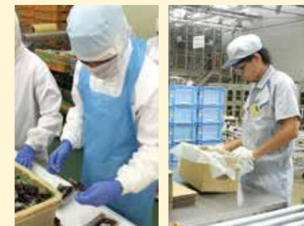
製造現場での現場実習の様子