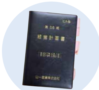
全社員に配布される手帳。たとえば社内恋愛に関する決まりまで具体的に書かれています。最初は戸惑った社員たちも、社長のストレートな思いに今では理解を示しているとのこと。

近年は私の経営カラーを全面に押し出す改革に乗り出しています。全社員と面談をし、一人ひとりの考えを理解しながら私の「思い」を伝えていきます。またチーム間の円滑なコミュニケーションを年3回実施し、費用の一部を会社が負担しています。トップと社員、また社員同士が関わりを密にし、社内の風通しを円滑にするための取り組みを具体的に手帳にまとめ、全社員に配布しています。 最初は戸惑いもあり、いろんな否定的な意見が出たこともありましたが、し