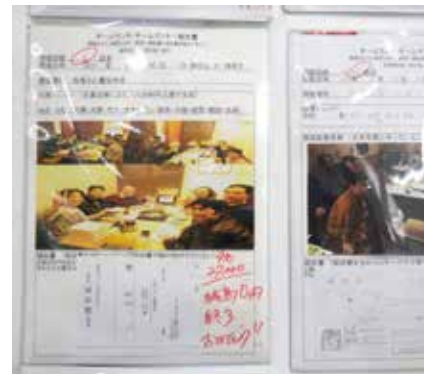
チームでの食事会報告書。親睦が目的のため、一人でも欠けてはいけません。チーム力の向上は会社を支える力につながります。

かし、「この会社をこうしたい。こんな風に歩んでいきたい」というトップのブレない考えがある限り、「思い」は伝わるものです。「ストレートでわかりやすい」とプラスにとらえてもらえるようになりました。今、会社が変わってきているのを実感しています。